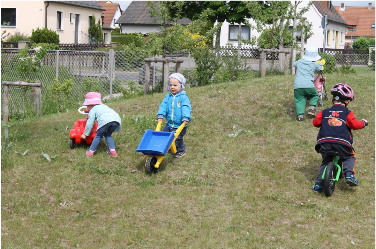
(Bewegung im Krippengarten)