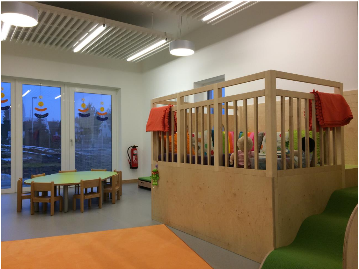
(Gruppenraum der Schmetterlingsgruppe)

Neben Gruppen- und Mehrzweckraum können auch die anderen Räumlichkeiten der Krippe wie Küche, Waschraum und Garderobe für gezielte Kleingruppenangebote genutzt werden. Ebenso steht uns ein großzügig angelegter Garten mit Vogelnestschaukel, Sandkasten und Rutsche zur Verfügung.