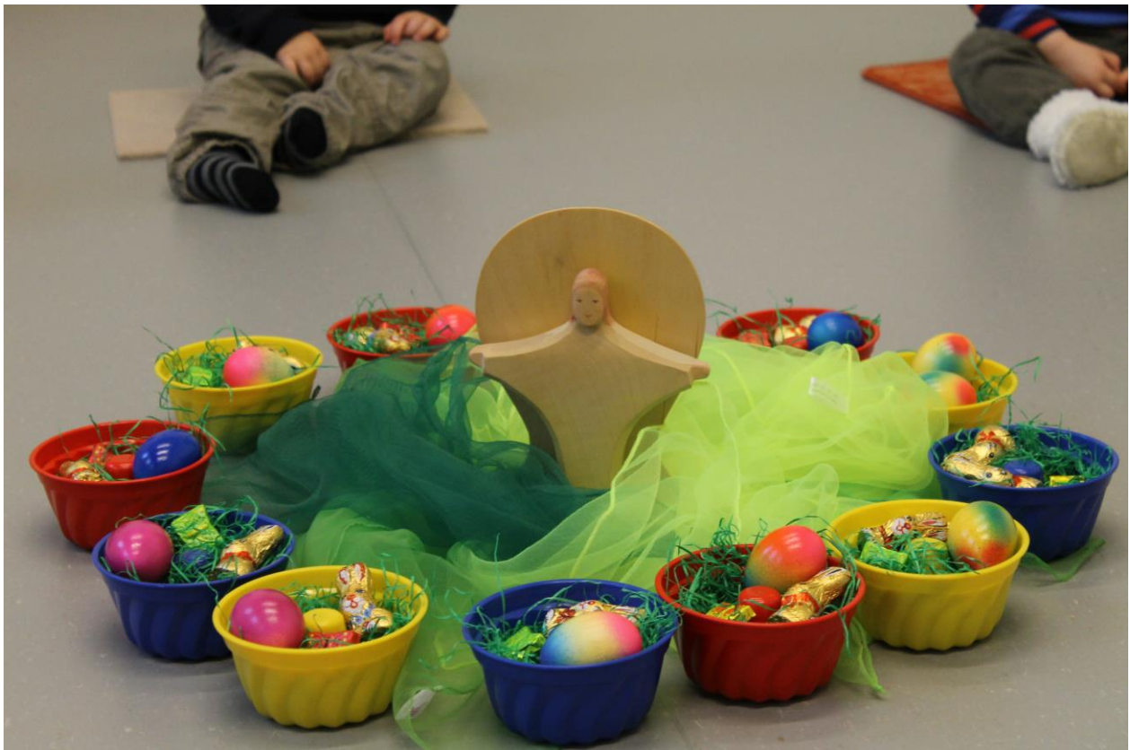
(Gestaltete Mitte im Morgenkreis zur Osterandacht)

Im christlichen Jahreskreis begegnen uns darüber hinaus Feste und Feiern (Erntedank, St. Martin, Advent, Weihnachten, Ostern), die uns im pädagogischen Alltag mit ihren Ritualen und Traditionen beschäftigen und die wir ganz bewusst mit den Kindern leben. Alle von uns durchgeführten Feste und Feiern für die Kinder werden im Gruppenalltag vor- und nachbereitet, die gemeinsame Vorfriede, die die Kinder aufgrund ihres Alters noch unterschiedlich intensiv erleben, stärkt das Zusammengehörigkeitsgefühl der Kinder.