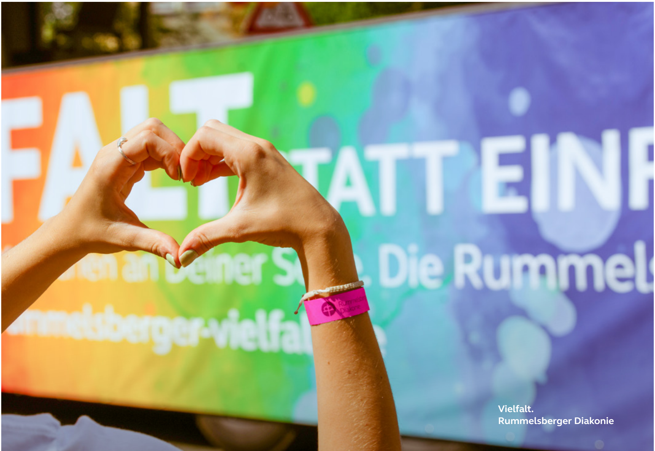
Vielfalt. Rummelsberger Diakonie